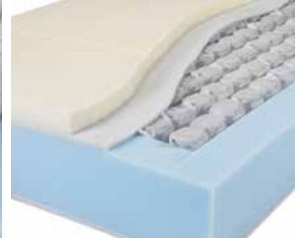
Particolari interno lastra